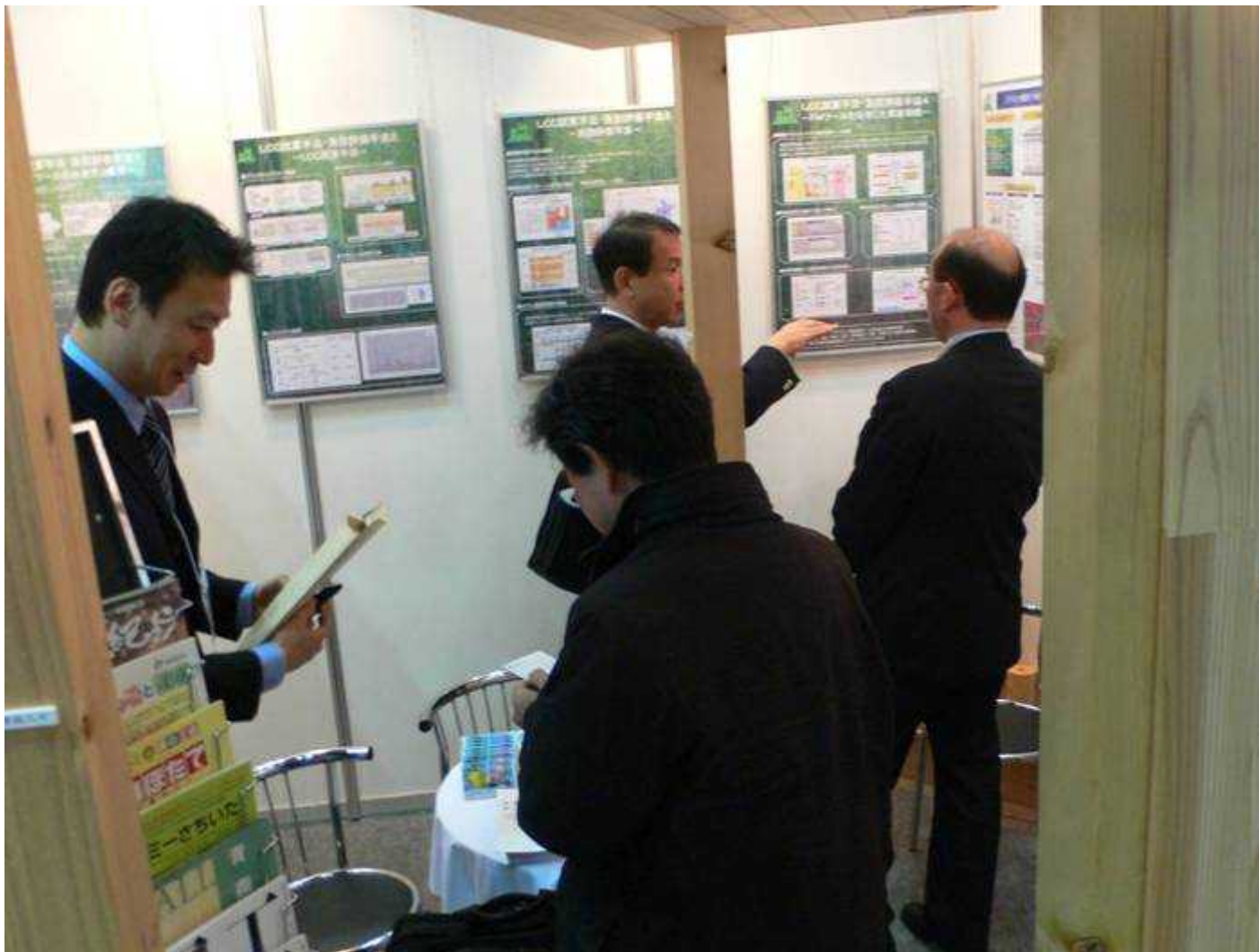
ブース内説明の様子3