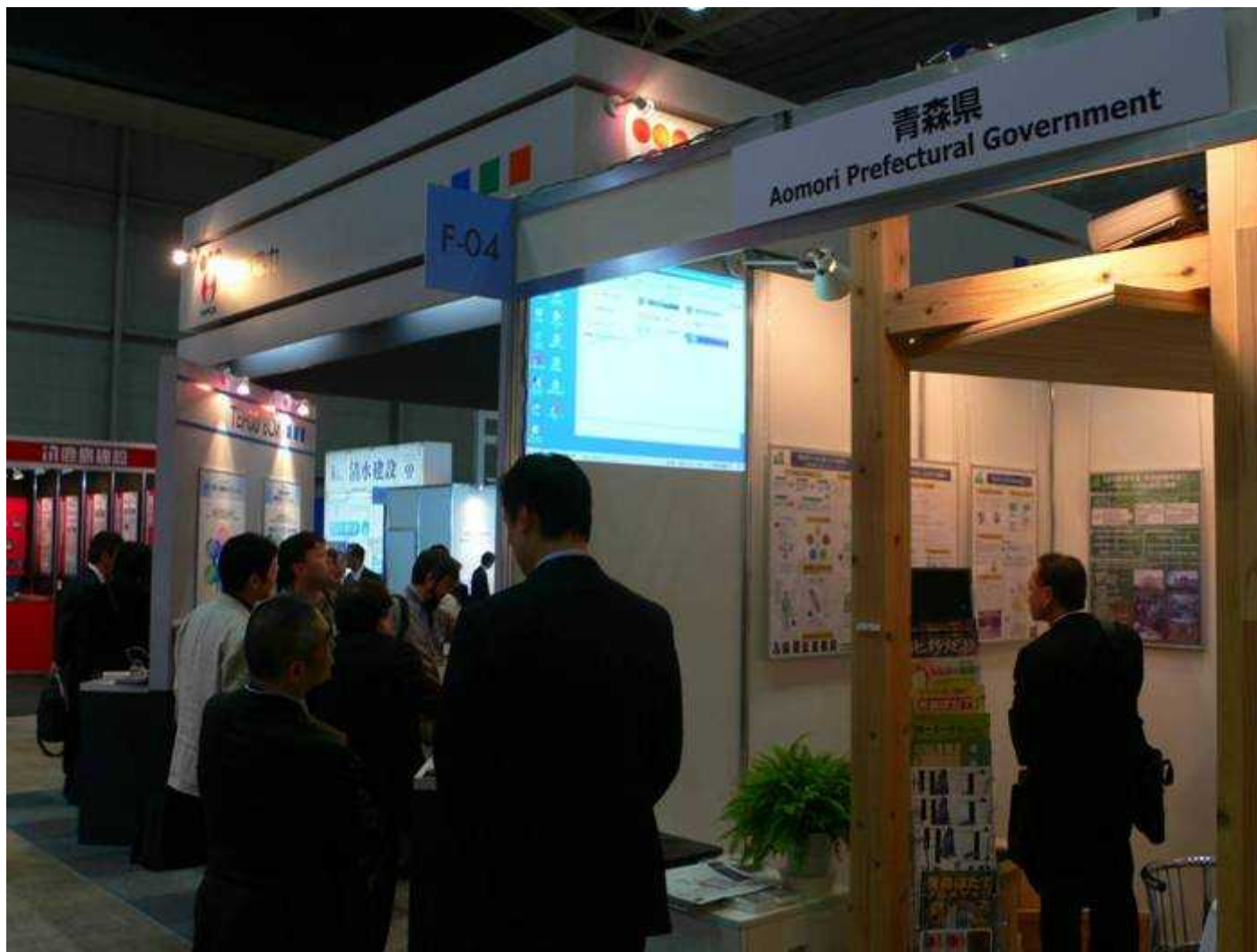
ブース内説明の様子4