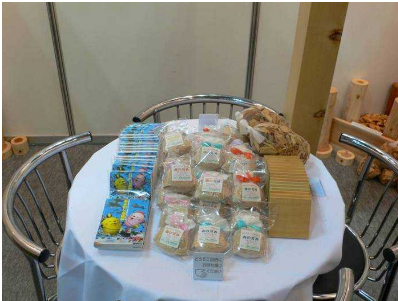
展示ブースの様子2 ブース中央にテーブルセット設置 県立浅虫水族館ティッシュ 県産木材関連(ヒバコースター、ヒバチップ、芳香剤)