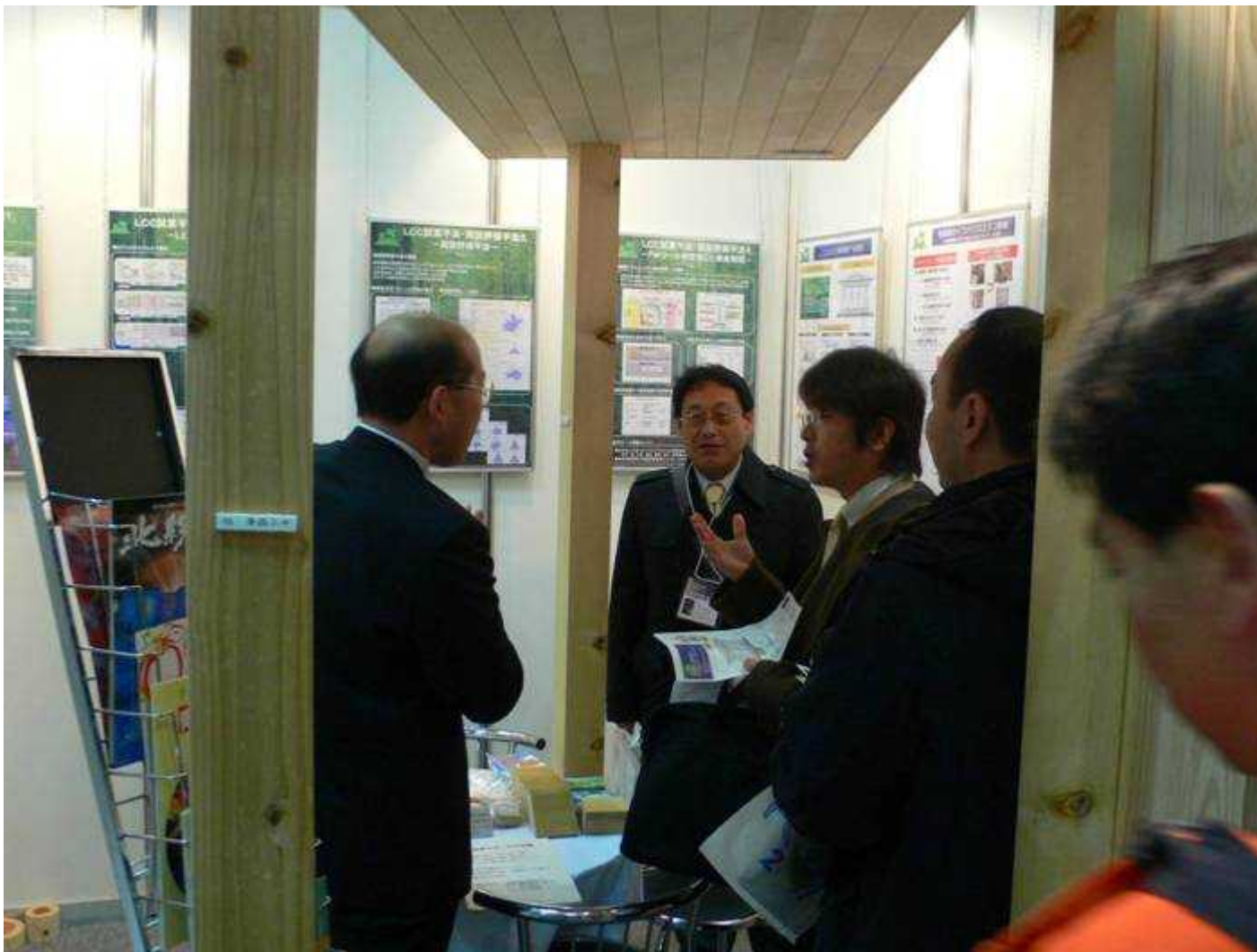
ブース内説明の様子1