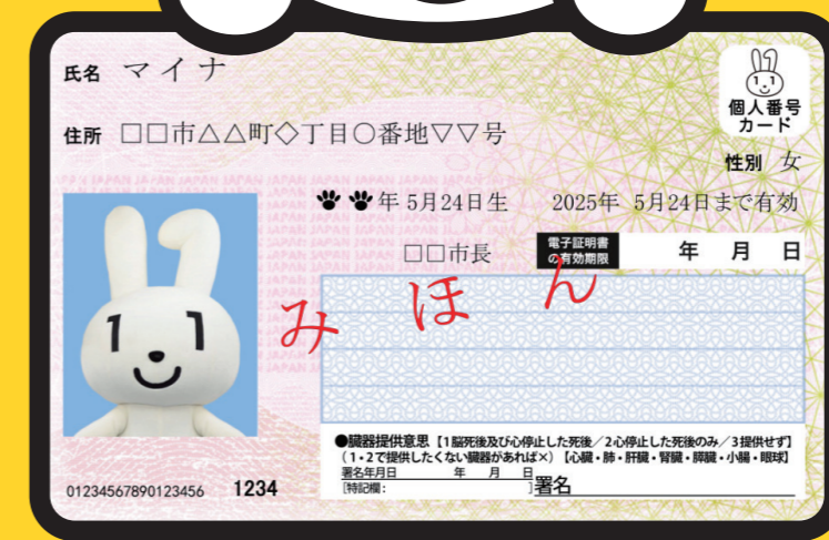
マイナンバーPRキャラクター マイナちゃん