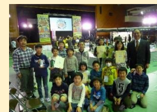
青森県げんねんジュニアロボットコンテストでは、毎回大健闘しています。