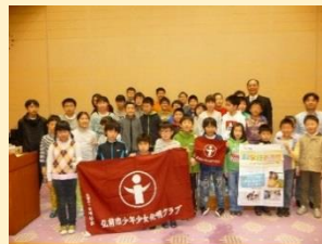
平成28年度の会員です。よろしくお願いいたします。