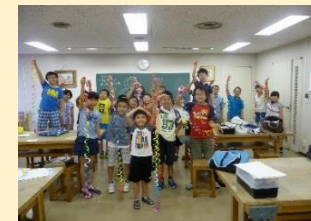
金澤指導員の「楽しい動きをするトムボーイ工作」講座。