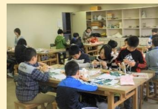
ものづくり講座は、どの子も、自主的な態度で作ります。