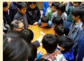
フィルムケースを使って残像現象の理論を真剣に学びます。