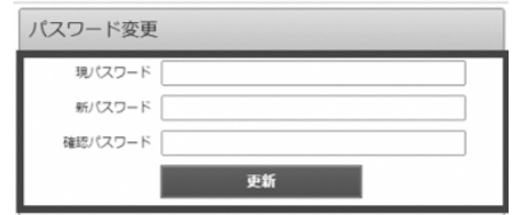
(パスワード変更画面)