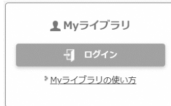
(Myライブラリログイン画面)