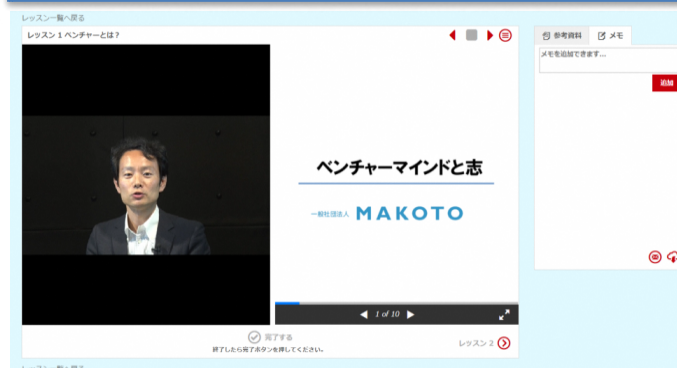
※プログラムイメージ

MAKOTO グループが提供するコンテンツを活用し、青森県内で創業・起業を検討されているお客様や、創業・起業後間もないお客様が、事業立ち上げから拡大までの各ステージに応じて必要となる知識を、オンライン上で「いつでも」、「どこでも」、「好きな講座から」気軽に習得できることが特徴です。