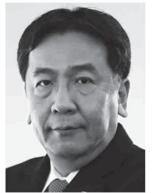
立憲民主党 代表 枝野幸男