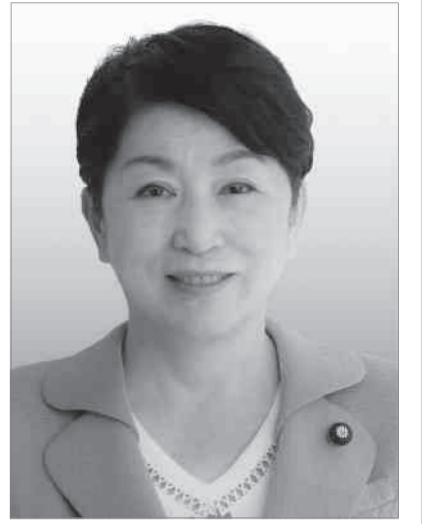
社民党党首 福島みずほ