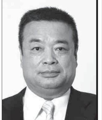
国民民主党 福島県総支部連合会代表