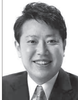
「加藤けんいちの思い」動画はこちら▶