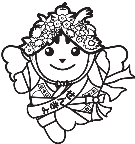
ねぶたハネトめいすいくん