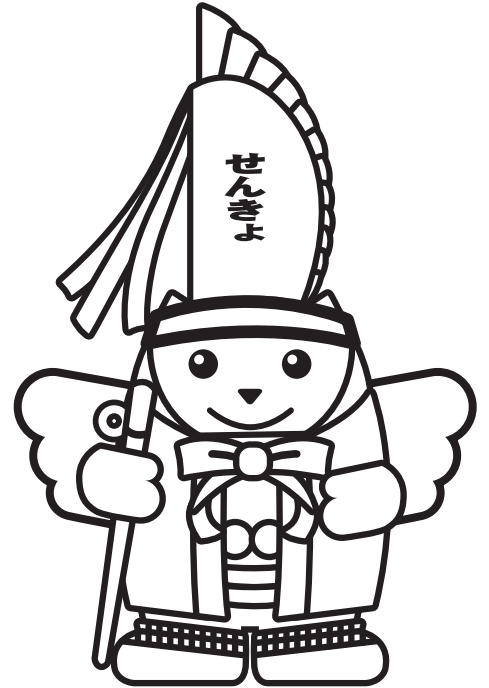
えんぶりめいすいくん