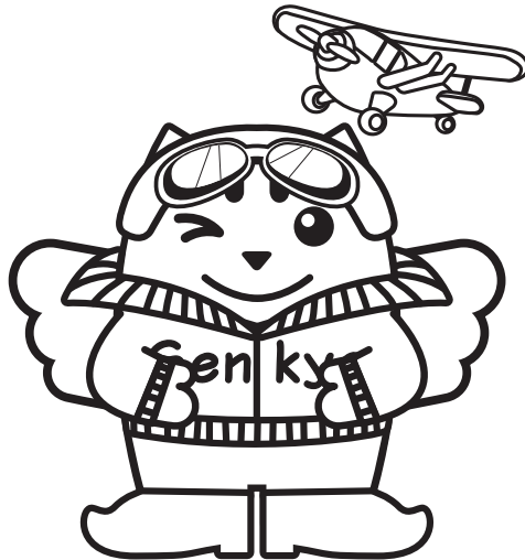
ビードルめいすいくん