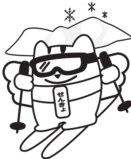
ざんまい 青森スキー三昧めいすいくん