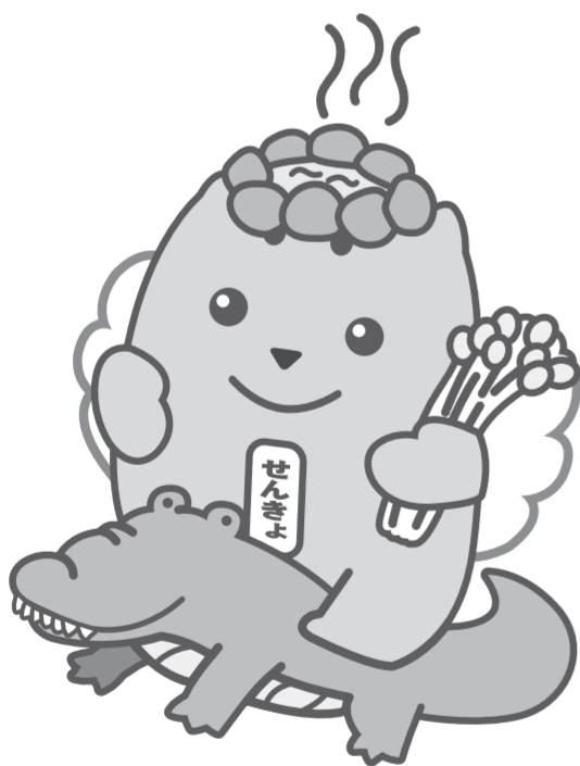
大鰐温泉もやしを愛するめいすいくん

期日前投票所の一覧を県選挙管理委員会ホームページに掲載しています。一部の投票所では、投票時間を変更していますので、ご注意ください。