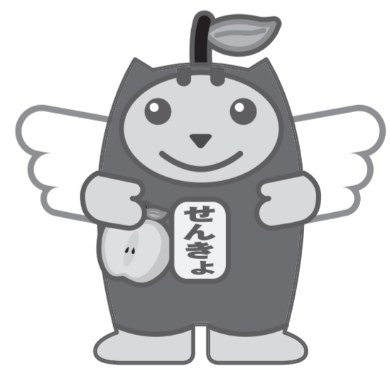
林檎っこめいすいくん

新型コロナウイルス感染症で自宅・宿泊療養などをされている有権者は特例郵便等投票が利用できます。