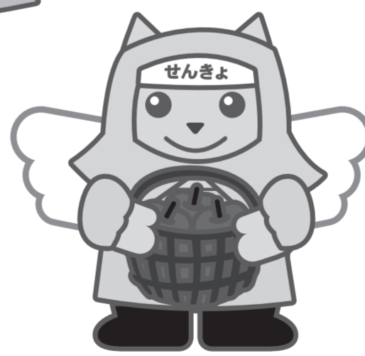
りんご農家めいすいくん