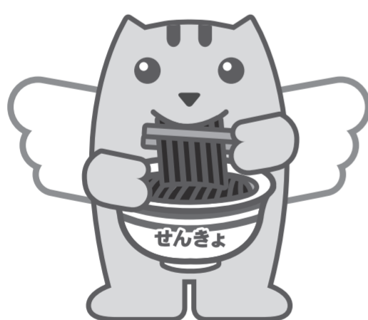
つゆ焼きそばめいすいくん

期日前投票所の一覧を県選挙管理委員会ホームページに掲載しています。一部の投票所では、投票時間を変更していますので、ご注意ください。