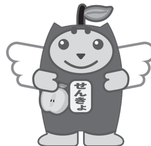
林檎っこめいすいくん

新型コロナウイルス感染症で自宅・宿泊療養などをされている有権者は特例郵便等投票が利用できます。