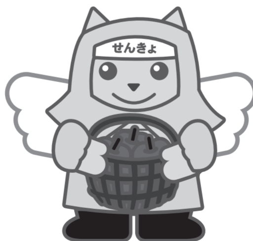
りんご農家めいすいくん