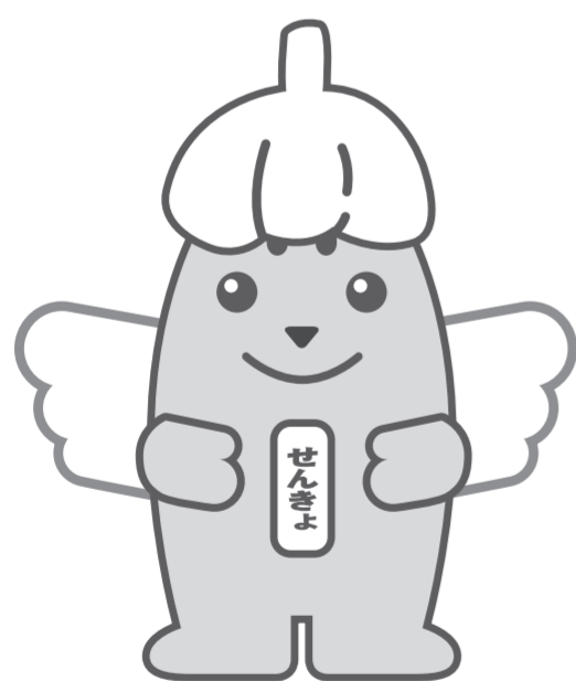
にんにくめいすいくん

期日前投票所の一覧を県選挙管理委員会ホームページに掲載しています。一部の投票所では、投票時間を変更していますので、ご注意ください。