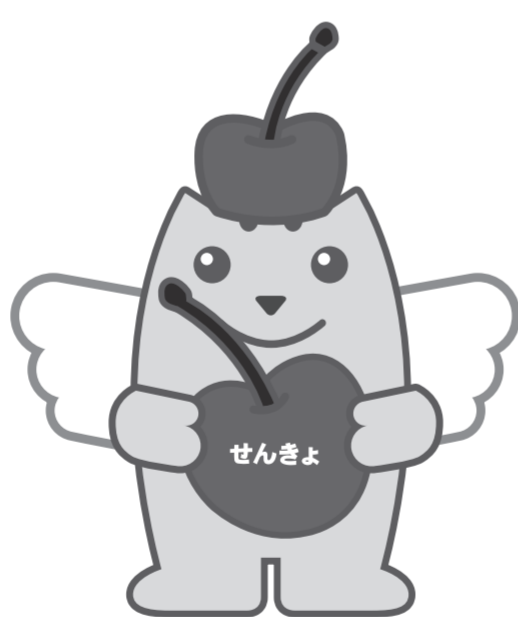
ジュノハートめいすいくん