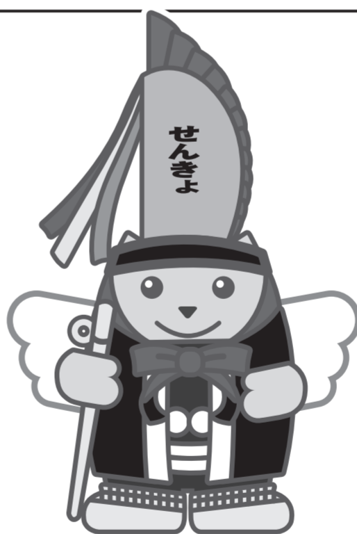
えんぶりめいすいくん