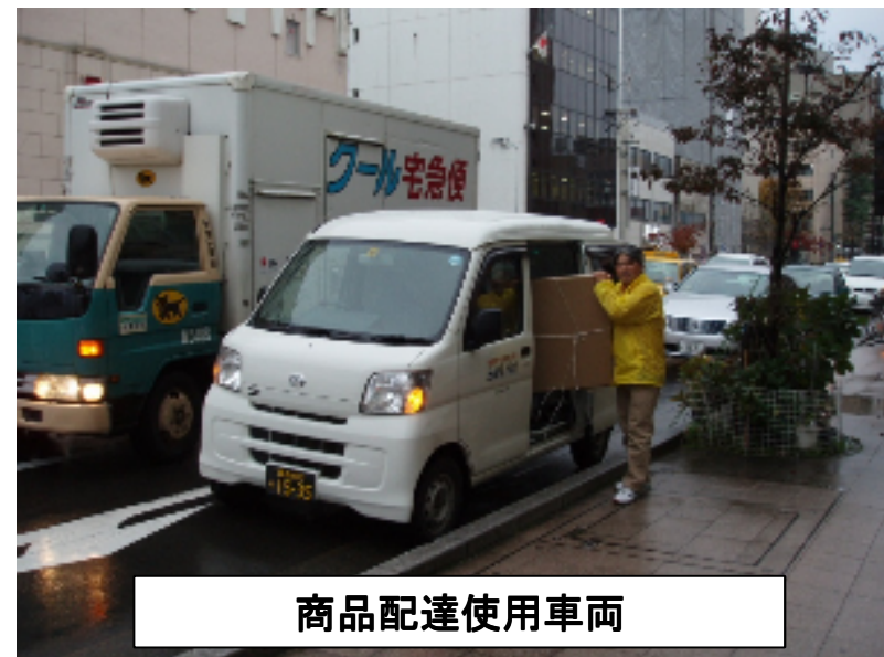
商品配達使用車両