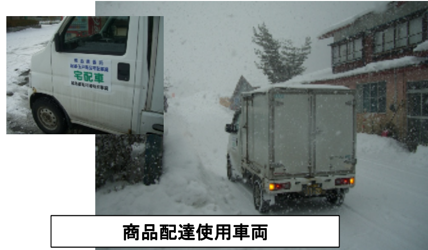
商品配達使用車両