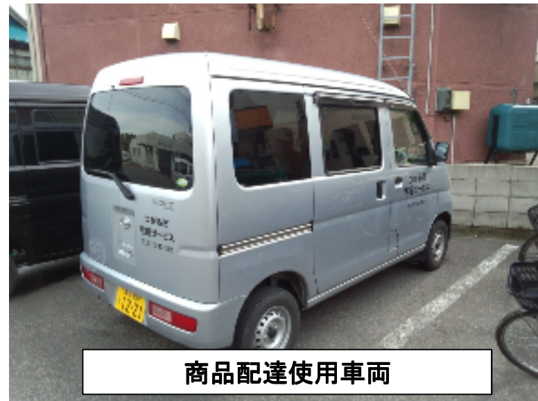
商品配達使用車両