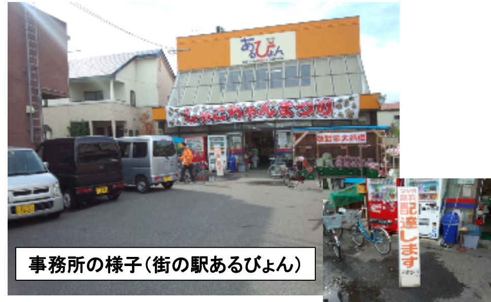
事務所の様子(街の駅あるびょん)