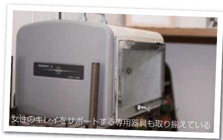
女性のキレイをサポートする専用器具も取り揃えている

一時期、エステサロンやマッサージサロンに通った事がありました。当時、そこのサロンで働いている方に憧れを抱き、そこで芽生えたのが