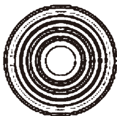
応用のイメージ図