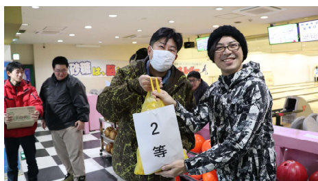
【全校ボウリング大会】