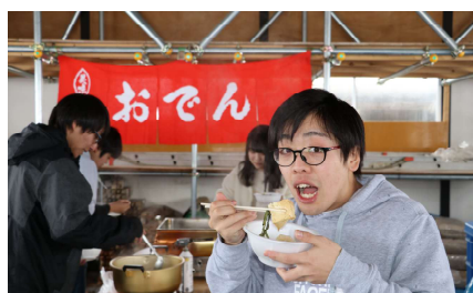
【各科レクリエーション】