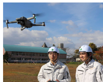
【ドローンを活用した実習】