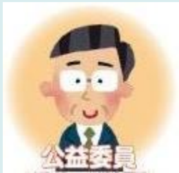
公益委員 (弁護士、大学教授等)

解雇や賃金など職場のトラブルでお悩みの方は、労働委員会の委員が労使双方の主張を聴いて調整し、 解決案の提示等を行って解決する「あっせん制度」 をご利用ください。