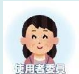
使用者委員 (会社経営者等)