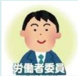
労働者委員 (労働組合役員等)