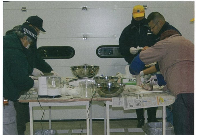
八戸市市場関係者によるマダラ検査作業

特に八戸市場のマダラについては、万全を期すため市場で販売される前に毎朝検査を行い、基準を超えた魚が流通しない体制を整えています。