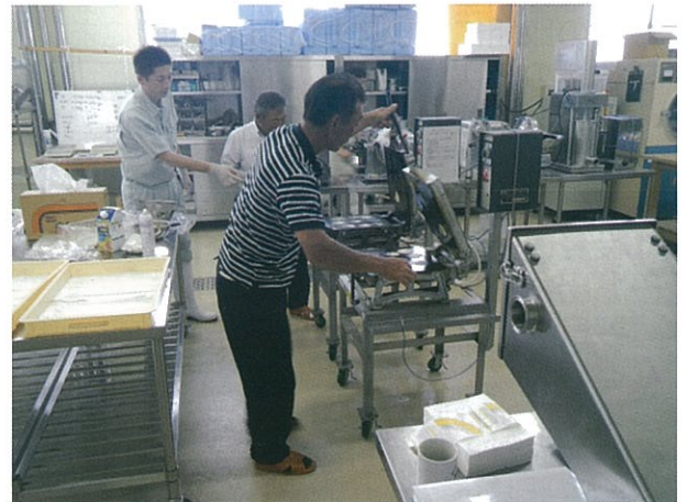
ほたて煎餅づくりの様子

また、4月から12月の3の付く日に、海の幸「3の市」を開催しました。3の市は新鮮な商品をお客様に直接販売し、また、どういう魚や乾物をお客様が求めているのかなどの意見を聞ける場でもあります。昨年は、漁が思わしくなく、十分に満足してもらえなかったと思います。今年もまた4月から「3の市」が始まりますが、新鮮でよりよい魚・海産物を提供し、工夫を凝らしたPRで、青森県の漁業に貢献していきたいと思っております。