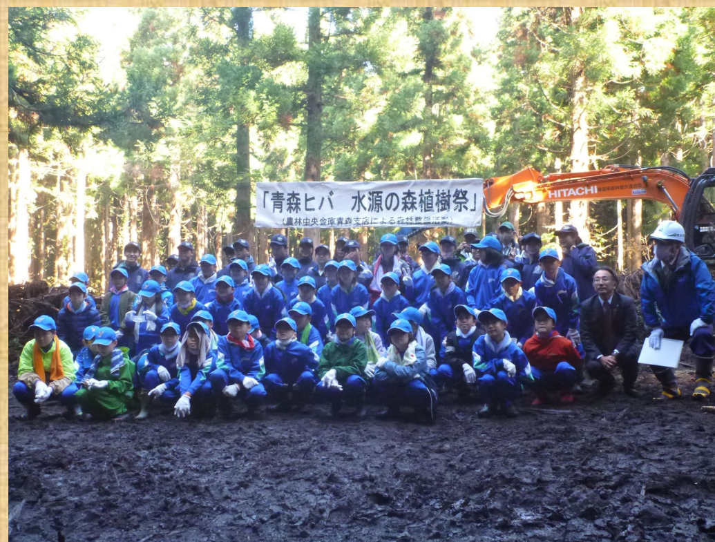
地元小学生によるヒバの植栽後、チェーンソー丸太輪切り体験を実施しました！