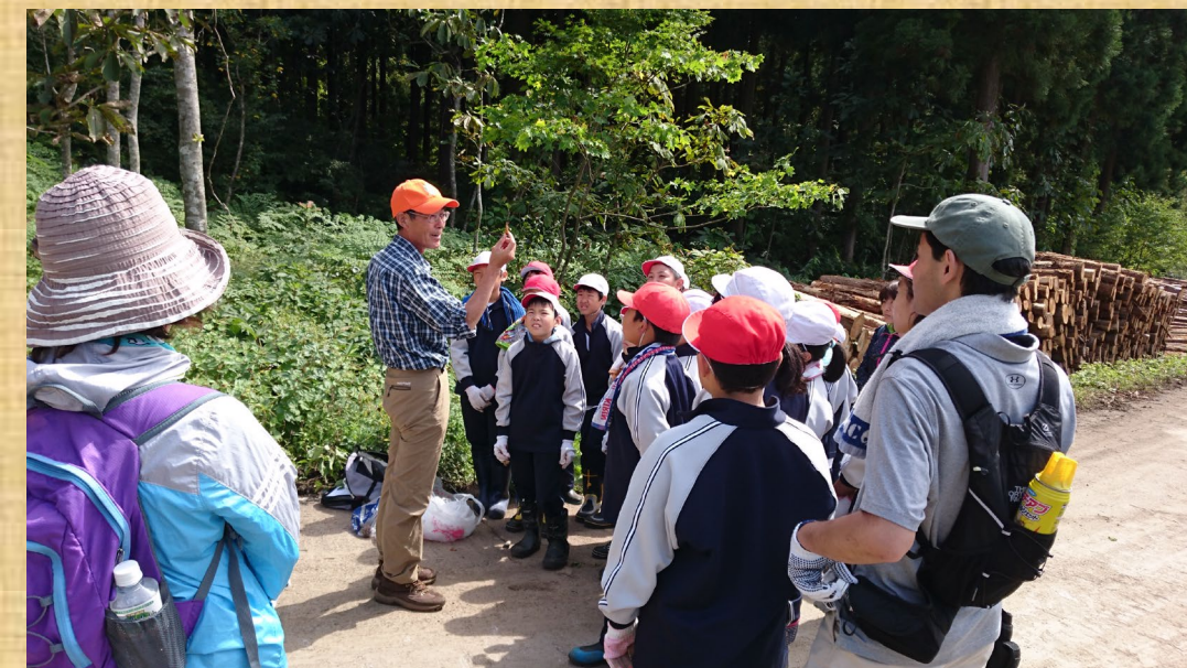
地元小学生によるヤマザクラの植栽後、森林教室を実施しました！