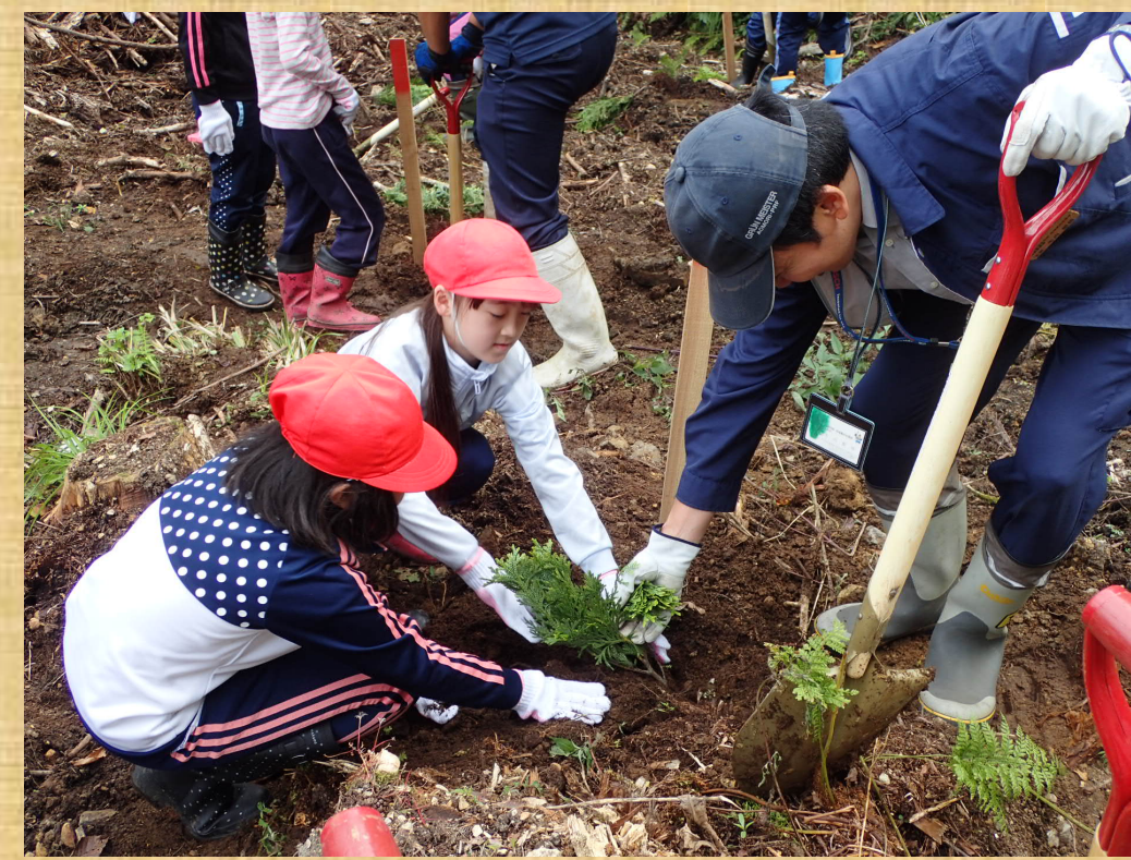
地元小学生がヒバを一本一本ていねいに植えました！