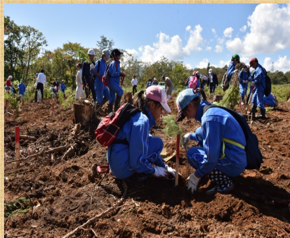
地元小学生によるカラマツの植栽後、丸太輪切り体験など森林教室を行いました