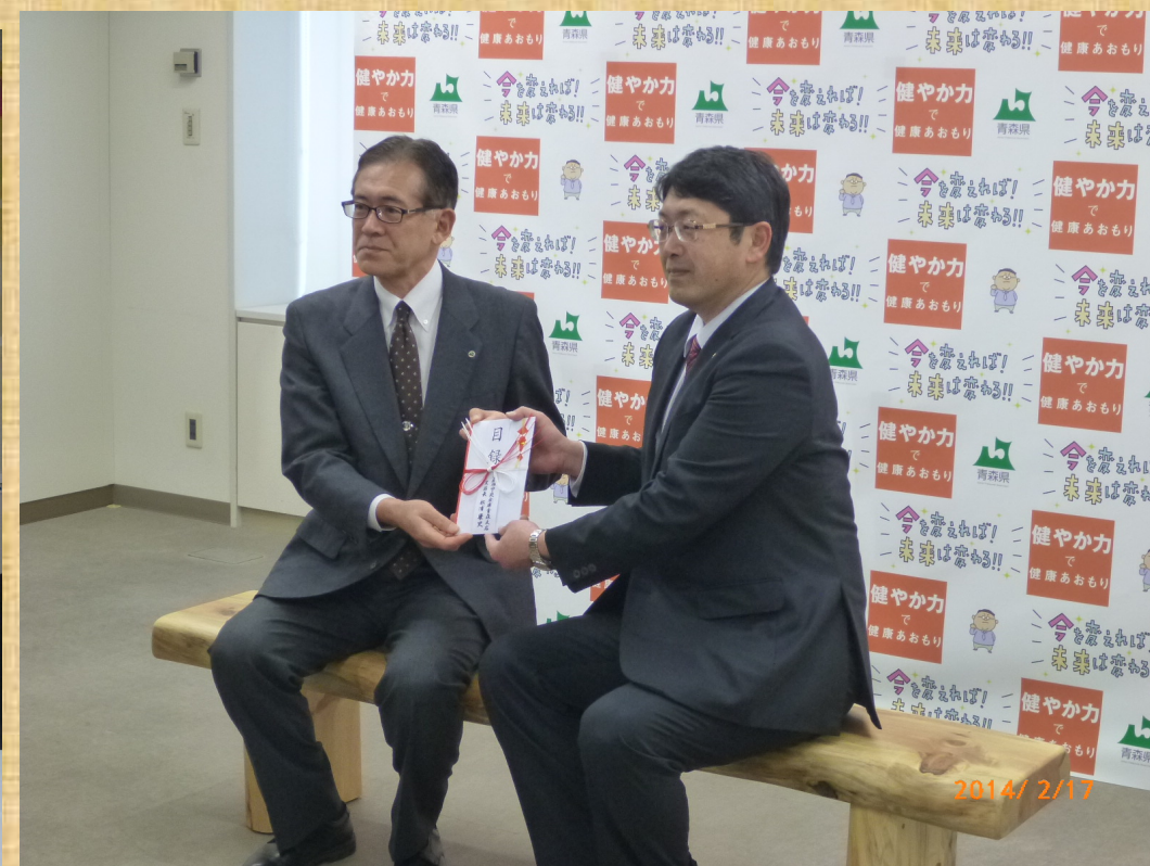
津波により被災したクロマツを有効活用し、ベンチを制作しました！