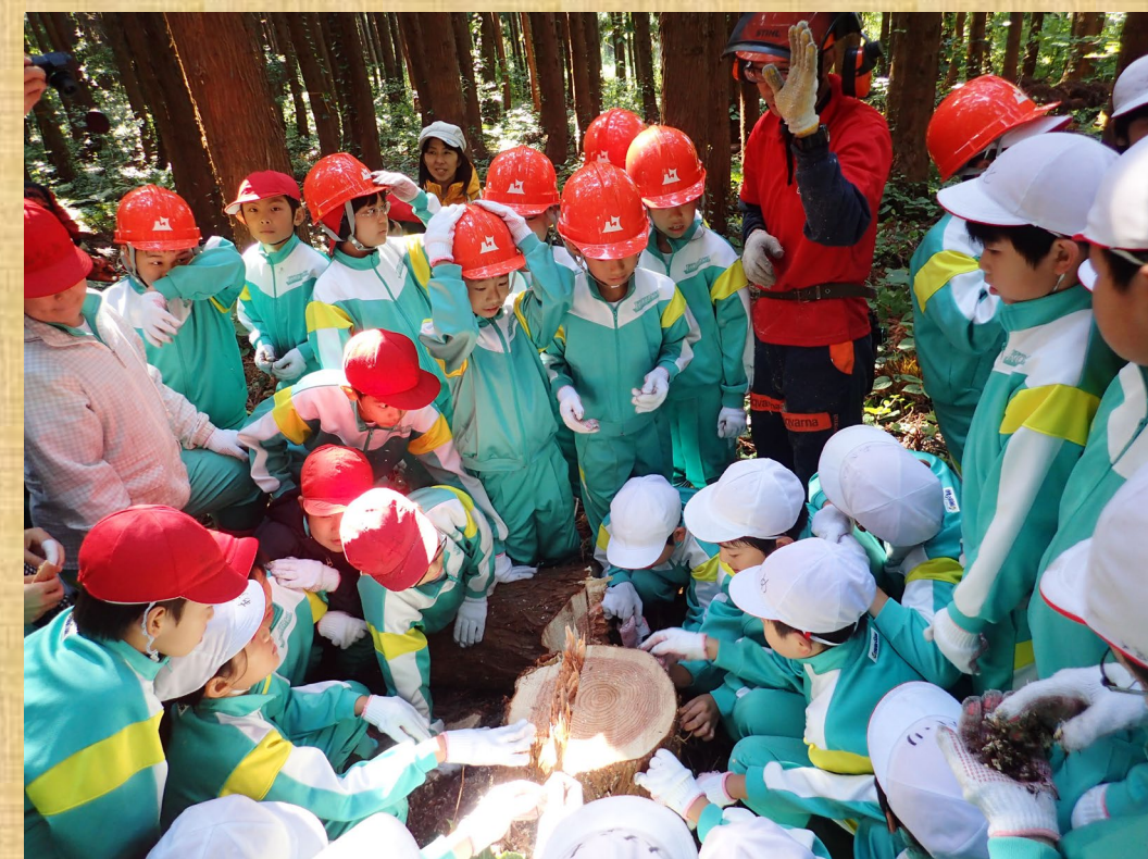
ヒバの植栽後、年輪数えや木登り等森林内で様々な体験活動を行いました！