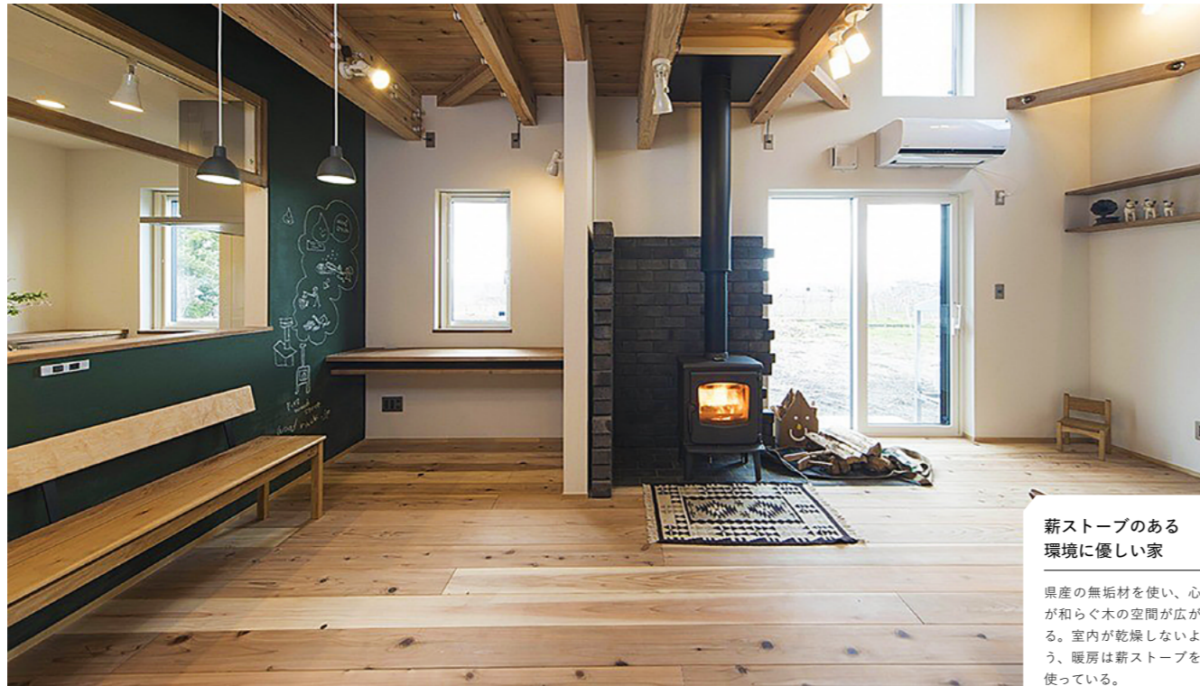
薪ストーブのある 環境に優しい家

県産の無垢材を使い、心が和らぐ木の空間が広がる。室内が乾燥しないよう、暖房は薪ストーブを使っている。