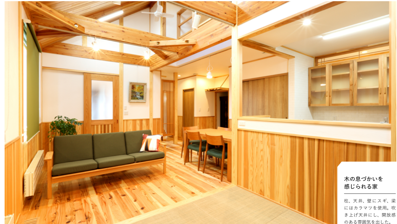
木の息づかいを 感じられる家

柱、天井、壁にスギ、梁にはカラマツを使用。吹き上げ天井にし、開放感のある雰囲気を出した。