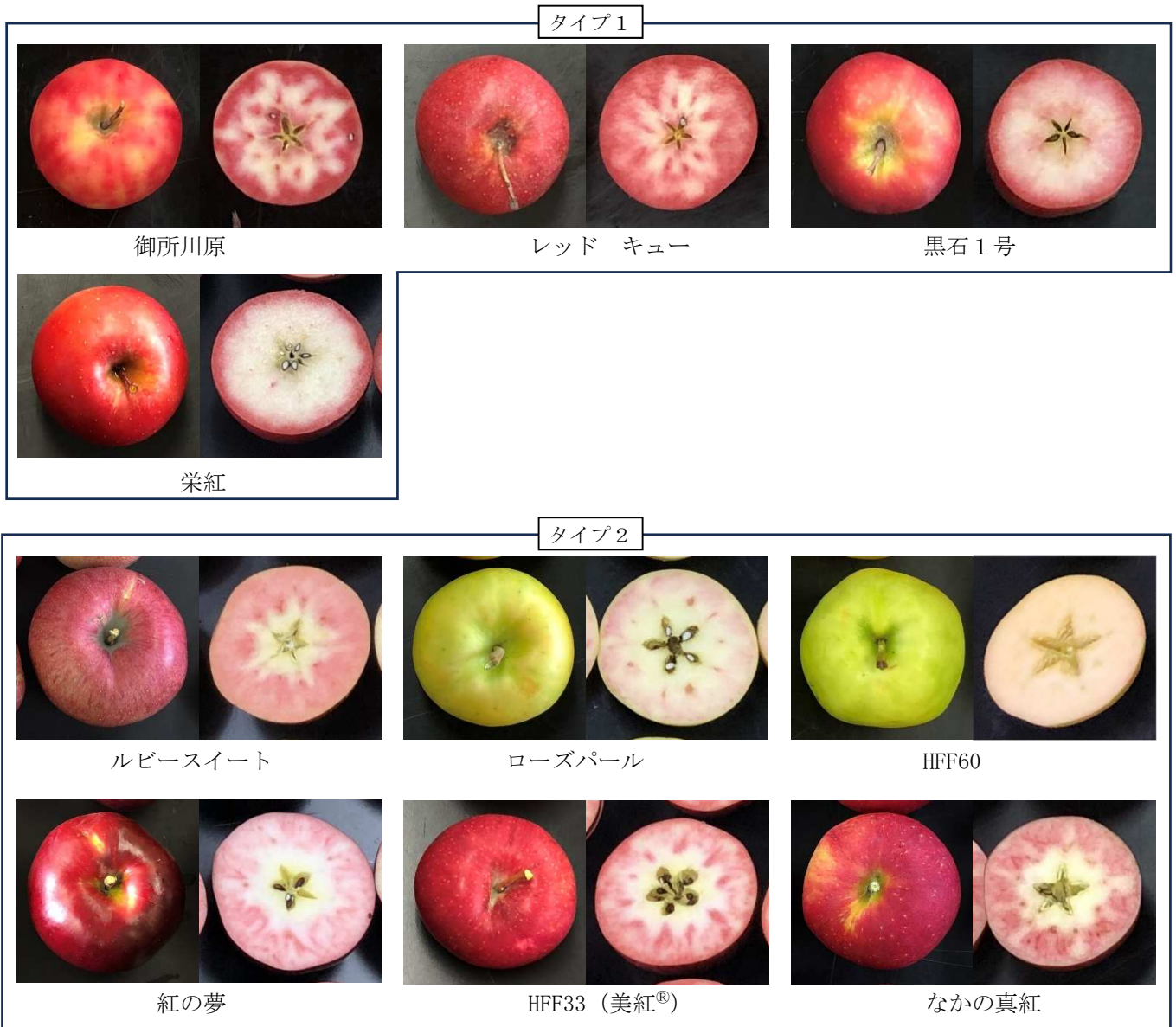
写真1 各品種の外観及び断面

箱の太線は中央値、上端は第3四分位数、下端は第1四分位数。上の実線の端は第3四分位数+1.5×IQR (第3四分位数-第1四分位数)より小さい最大値、下の実線の端は第1四分位数-1.5×IQRより大きい最小値、○は外れ値、箱中の×は平均値。