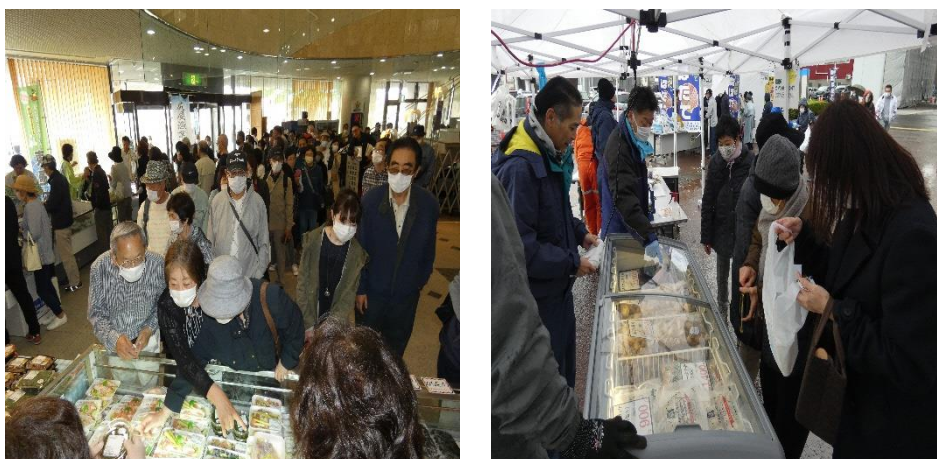
水産ビルで行われたイベントの様子

県内各漁協が浜自慢の水産物を持ち寄り、消費者との対面販売を定期的（5月、11月）に開催した。イベントでは多くの消費者が来場し、目当ての水産物を買求め、非常に好感触であった。