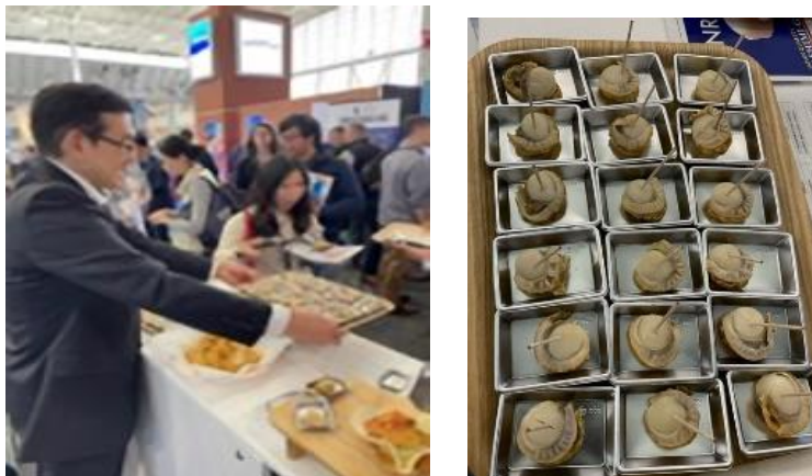
ボストンでのホタテPR

ボストン（3月）やシンガポール（9月）等、本会役員が自ら現地へ出向き水産加工品のトップセールスを行うことで、海外プロモーションを積極展開した。