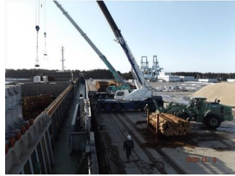
〈② 船舶への積込作業（吊り上げ）〉