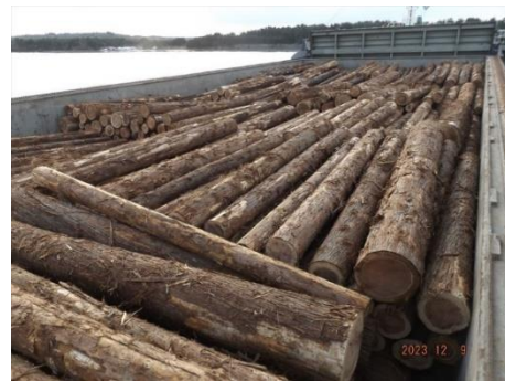
〈④ 船舶への積込作業（原木積込完了）〉