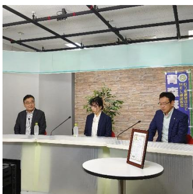
地元放送局でのPR活動

地元放送局での県産ホタテPRや、首都圏で開催された大規模イベントに参加する等、積極的な販促活動を展開した。