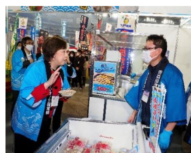
首都圏でのイベント風景