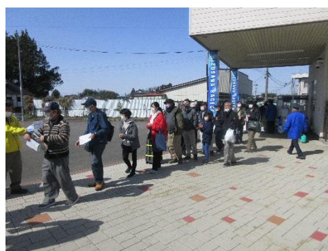
ミルクウイークイベント