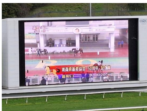
冠協賛レース 企業・商品PR