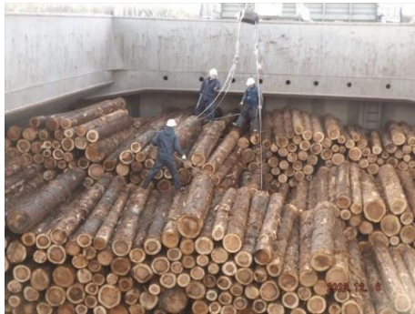
〈③ 船舶への積込作業（船内の状況）〉