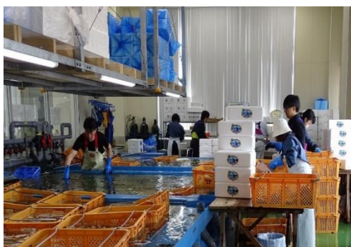
活ホタテ出荷風景

陸奥湾が育む本県自慢の水産物である活ホタテを積極的に市場出荷することで、PR活動を活発化させるとともに、消費拡大を目的として開催された各種イベントへ積極的に出展する等、国内需要拡大に向けた取組みを実施した。