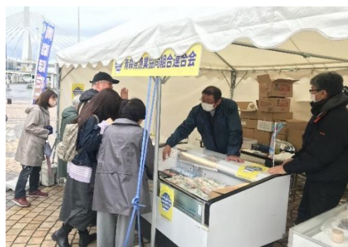
ホタテを食べようホタテを守ろう青森県！