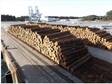
〈① 山土場から港湾に運ばれた原木〉