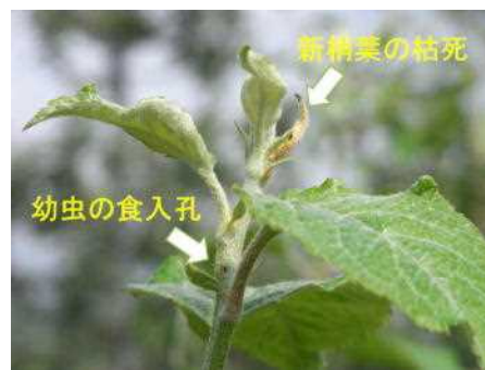
図3 新梢先端の被害 (芯折れ)

(注) 殺虫剤無散布圃場の5樹の全新梢を対象に、新規に発生した芯折れの数を計数した。6月3日以前は芯折れは認められなかった。