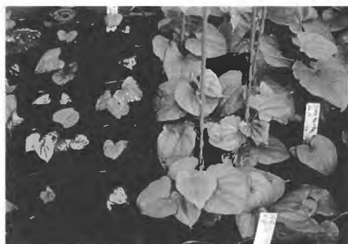
図2 組織培養個体の育成初期の生育：モザイク病発病株（左）と無病株（右）