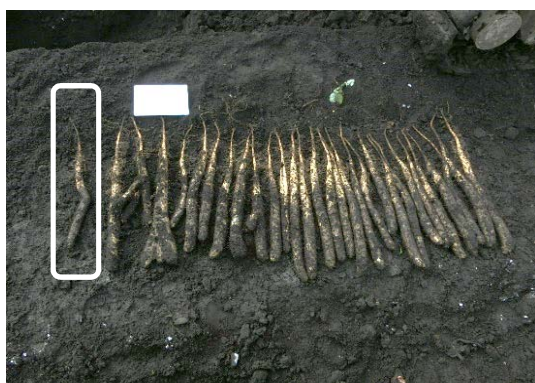
深暗渠ありの区域