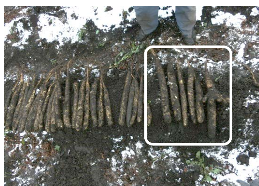
深暗渠なしの区域