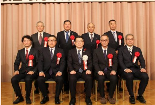
【令和元年度認定証書授与式】