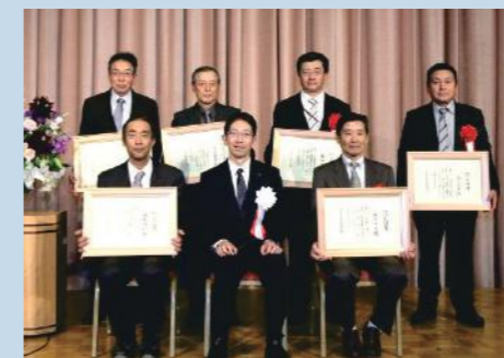
【平成28年度認定証書授与式】

地域の生産者に自身の土づくり技術の指導や消費者等に対する情報発信などの活動を行います。