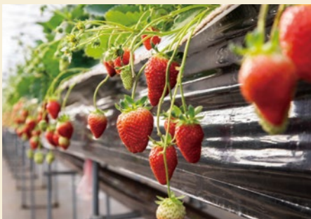
おいしいいちごはへたまで真っ赤になり、さらに反っているそう