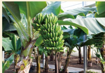
バナナの木は沖縄から取り寄せたもの