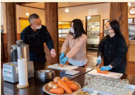
農園で採れた野菜でピクルス作り