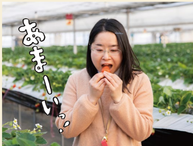
「いちごの味が濃い!」4品種食べ比べてみて!