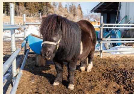
ポニーやヤギと触れ合ったり、餌やりも体験できます