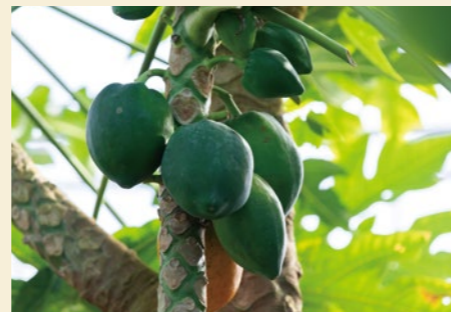
木に実っているのはパパイア。完熟までじっくり待ちます