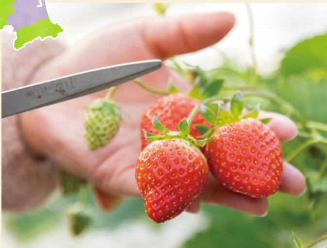
ツツヤのいちごは宝石のよう!