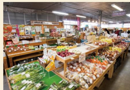
果樹園で採りたいちごをはじめ、フルーツは大人気。地元客でにぎわっています