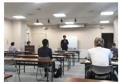
創業・起業支援制度説明会にて