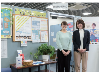
アスパム内の「サポステ」ブース