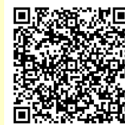
下北教育事務所 QRコード

社会教育だより「かけ橋」はバックナンバーも含めて下北教育事務所のホームページでご覧になれます。