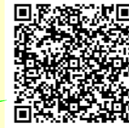
下北教育事務所 QRコード

社会教育だより「かけ橋」はバックナンバーも含めて下北教育事務所のホームページでご覧になれます。