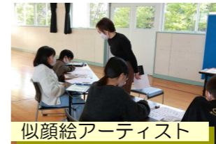
似顔絵アーティスト