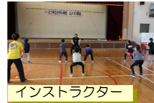
インストラクター