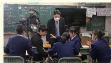
どんな順序で質問しようか、入念に打ち合わせを行いました。