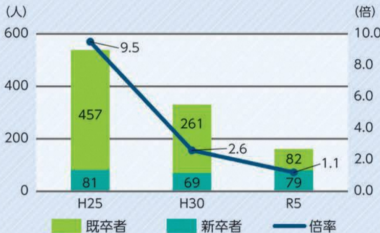
教員採用試験の小学校の応募者数と倍率の推移

『あおもりで働こう』小学校教員魅力向上事業では、そのような教員の魅力を発信するとともに、教員の確保に向けた取組を進めています。