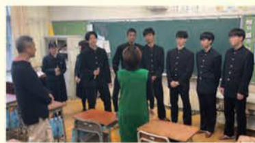
インタビュー開始前、FM局のパーソナリティからアドバイスをもらいました。