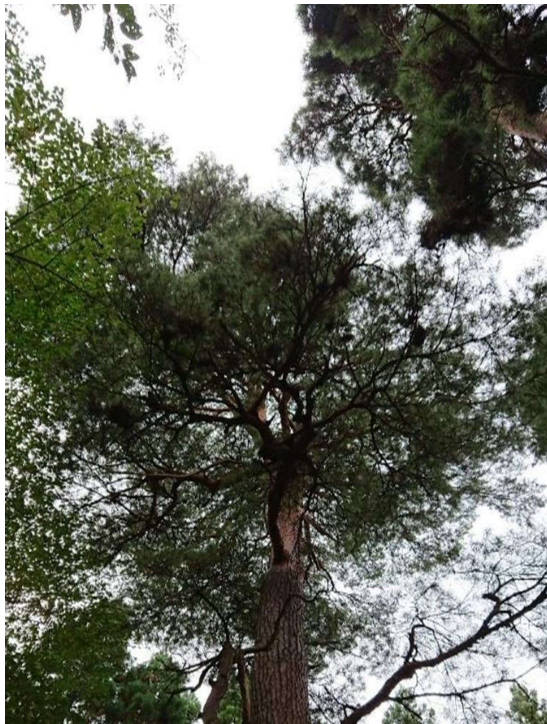
追加指定候補の樹勢