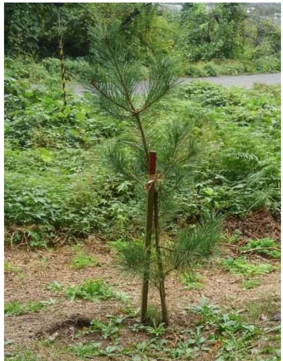
5年前に植樹した苗木