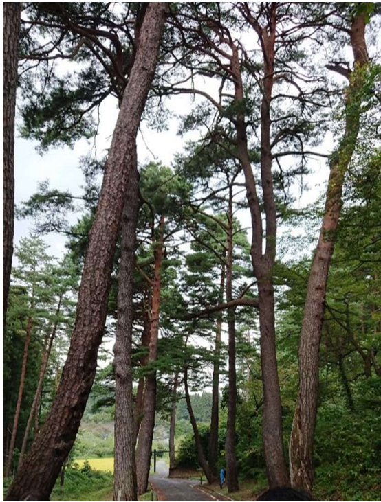
追加指定する松並木の様子