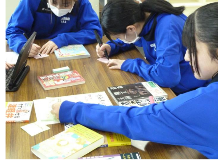
〈関連本を図書室から探して持ち寄る〉