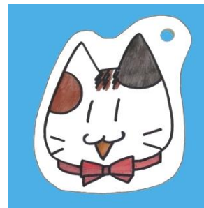
<色鉛筆で色をぬったもの>