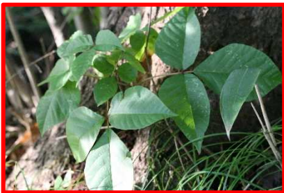
【キケン！ ツタウルシ】 これもさわらないで！ヤマウルシよりも強力だよ。3枚の葉とはっきりした葉のすじが特徴的。