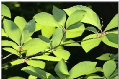
【オオバクロモジ】 枝をおって、においをかいてみよう。 とってもさわやかな、いいにおいがします。