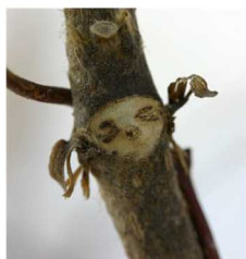
【クズの葉痕】 よく見ると、葉っぱのとれたあとが、なんだか顔に見えませんか？