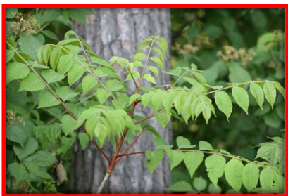
【キケン！ ヤマウルシ】 さわると肌がかぶれる場合があるので注意！葉柄（葉っぱの軸）が赤いのが特徴です。