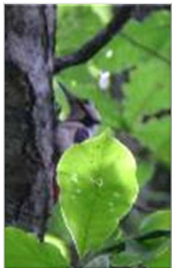
【アカゲラ】 キツツキの仲間です。「ゲッ！ゲッ！」という鳴き声 が特徴だよ。