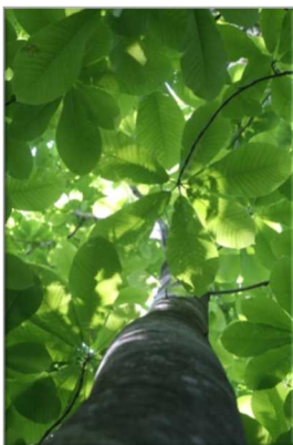
【ホオの木】 自然の家周辺の植物の中で、最大級の大きさの葉を付けます。ぜひ見つけてね。