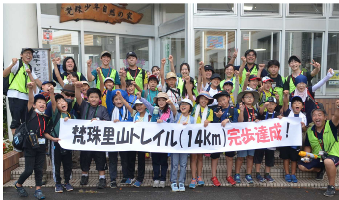
苦しかった14km。全員笑顔でゴール! みんなよく頑張った!