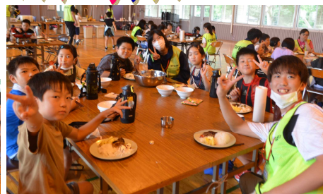
おいそな手作りハンバーグの完成!

親から離れての2泊3日。不安やさみしさもあったけど、新しい仲間と協力しながら無事最後まで活動できました。活動を楽しむのはもちろん、家族の支えにあらためて気づいたり、自分の頑張りを実感できたりしました。このキャンプでの経験を、明日からの自分の生活にいかしながら、新たなことにどんどんチャレンジしてくれることを願っています。