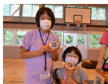
記念の「ネックレス」の完成!