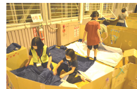
段ボール基地完成。寝る準備中