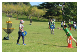
「ディスクゴルフ」そ~れっ!