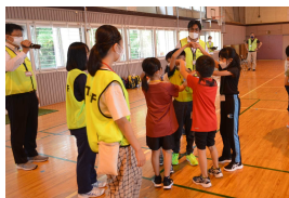
まずは、「仲間づくりゲーム」