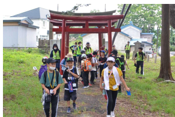
「お宝カード」を探しながら歩いたよ。