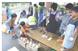
牛乳パックで加熱する「カートンドック」