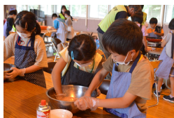
挽肉を手でこねます。