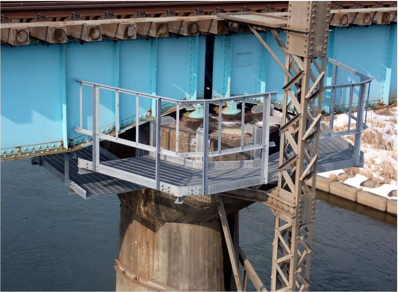
第4馬淵川橋りょう検査足場新設（三戸・諏訪ノ平間）