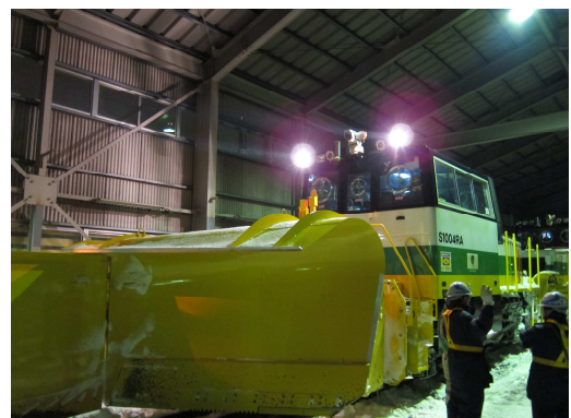
鉄道施設保守作業（除雪作業）