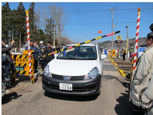
踏切事故防止訓練会（脱出訓練）

日本貨物鉄道(株)東北支社が主催した訓練に参加し、盛岡貨物ターミナル駅を会場に、機関車脱線の復旧等について訓練しました。（平成24年9月28日）