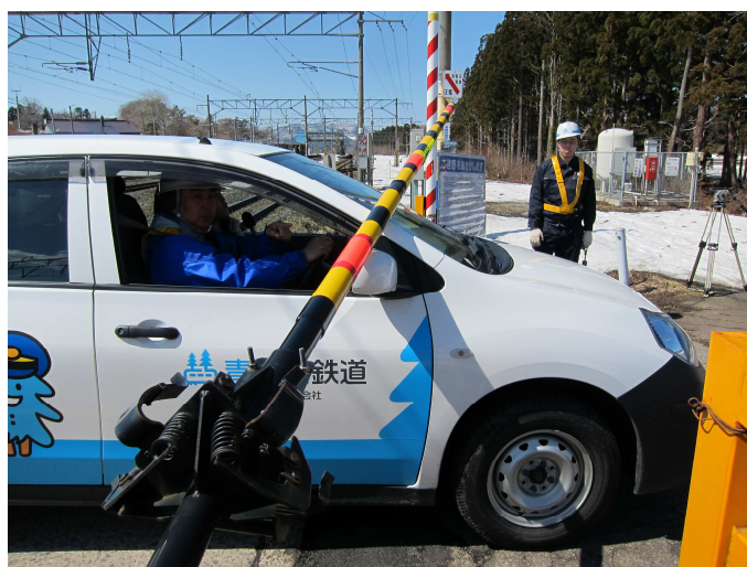
踏切事故防止訓練（平内町・福島道踏切）