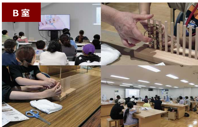
本プロジェクトの経緯や記録 (これまでの取組や課題解決の過程等を展示)