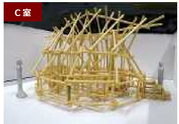
丸太（端材再利用）と木製漁網編み治具 約千個による竪穴式住居をイメージした インスタレーション