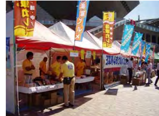
19年10月 海軍グルメ交流会