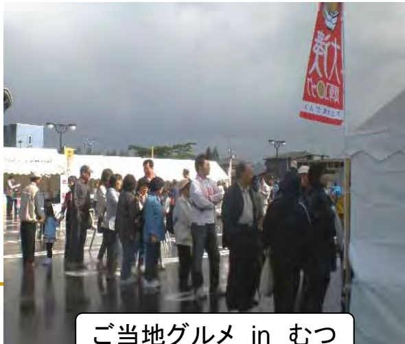
ご当地グルメ in むつ