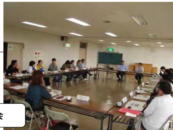
販売店同士の情報交換会