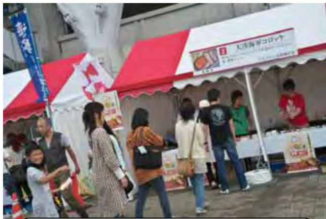
全国B級グルメスタジアム(5月)