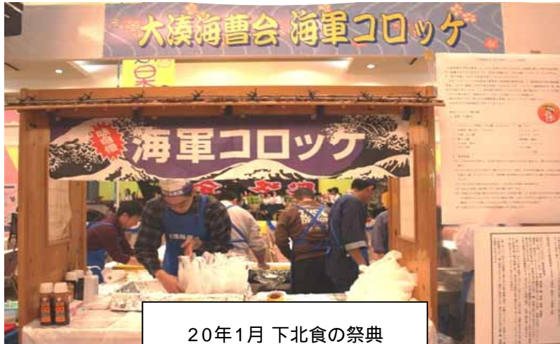
20年1月 下北食の祭典