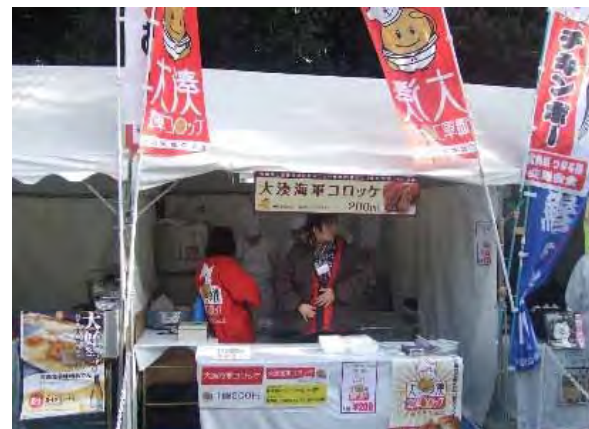
とことん青森2010in原宿表参道(1月)