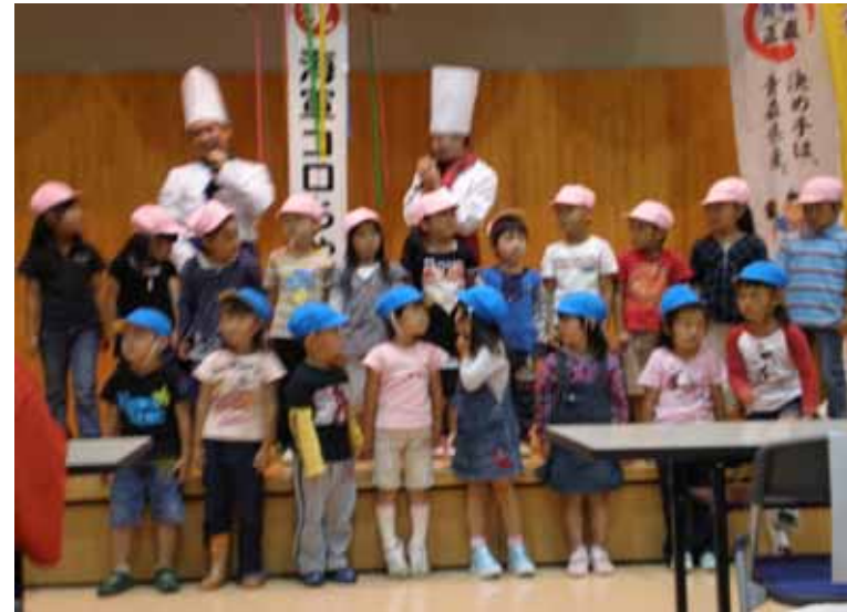
大湊海軍コロッケ1周年誕生祭(9月26日)