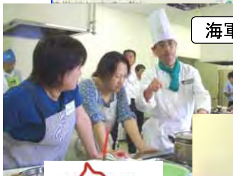
海軍コロッケ試作会

地元の印刷会社が16案をデザインし、一般住民による投票・下北グルメ活用検討会による審査を行い、決定