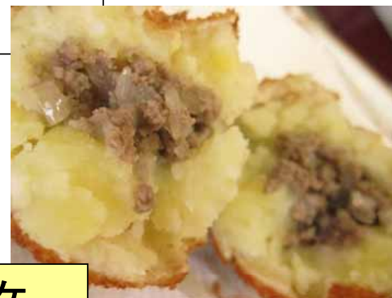
海軍時代のコロッケ