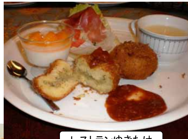
レストランゆきたけ