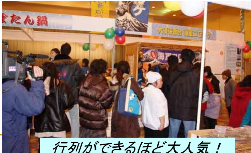
行列ができるほど大人気！