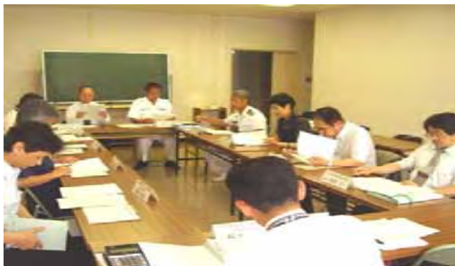
下北グルメ活用検討会