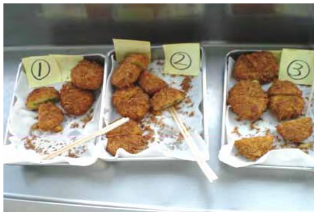
海軍コロッケの試作