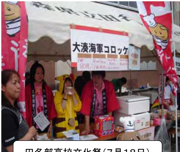
田名部高校文化祭(7月18日)