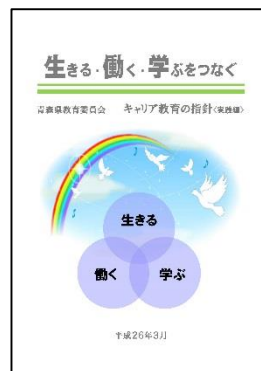
「キャリア教育の指針(実践編)」