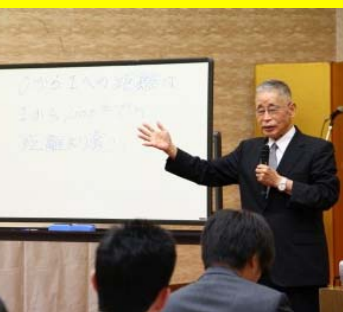
鍵山秀三郎氏 (株イエローハット創業者)