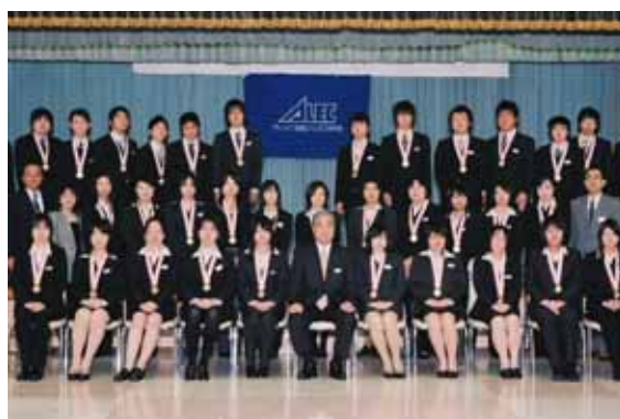
情報処理技術者試験等合格者への金メダル授与式