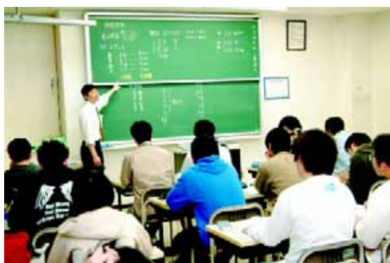
情報処理技術者試験講座の講義風景