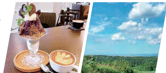
インスタ映え必至のパフェ 小牧野遺跡の展望台から

遠出して青森に帰ってくると、なぜかスッキリした気持ちになります。食べ物はおいしいし、ワーケーションにもふさわしく、囲まれた自然の中で心を浄化させることができる絶好の場所。隙間時間に洋画を、休日は飼い猫と過ごしてリフレッシュ!