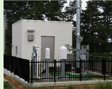
モニタリングステーション モニタリングポスト

施設の周辺に設置された測定局において、空間放射線量率や大気中の放射性物質の濃度等、気象状況を24時間連続で測定