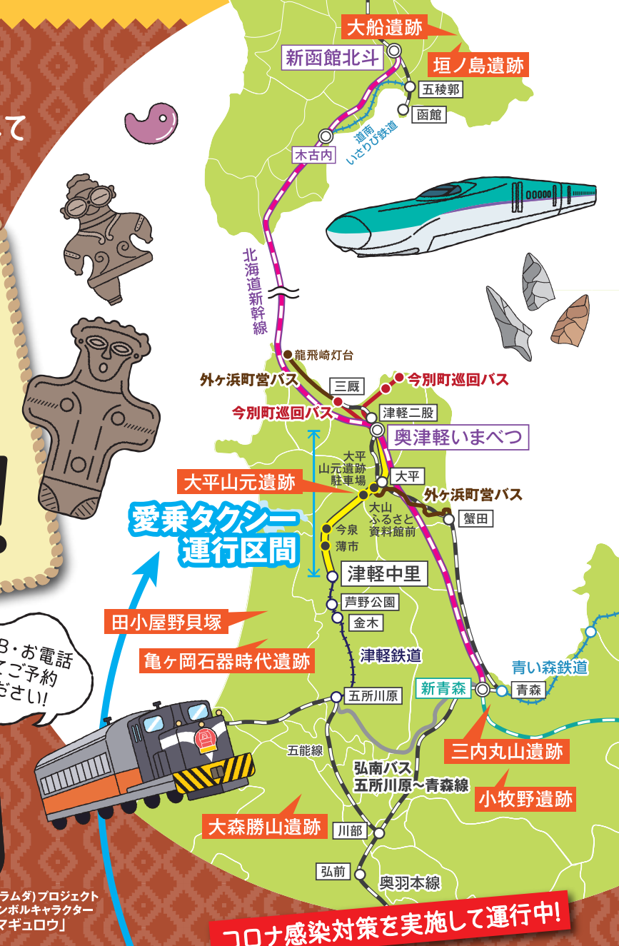
津軽鉄道イメージ キャラクター 「つてっちゃん」