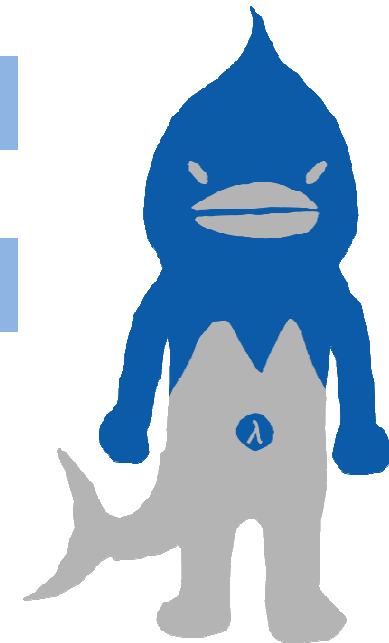
λ(ラムダ)プロジェクトシンボルキャラクター マギユロウ