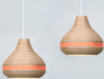
コピー部門:BUNACO ペンダントランプ 「garlic」BL-P1942(2個セット):1名様