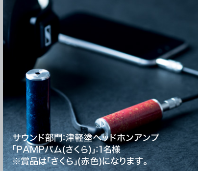
サウンド部門:津軽塗ヘッドホンアンプ 「PAMPパム(さくら)」:1名様 ※賞品は「さくら」(赤色)になります。