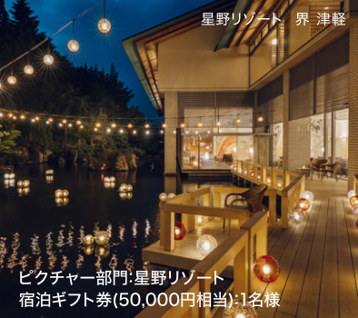
ピクチャー部門:星野リゾート 宿泊ギフト券(50,000円相当):1名様