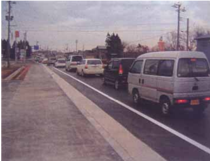
終点交差点部渋滞状況