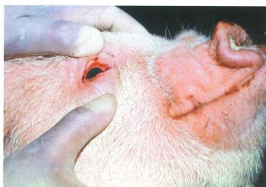
豚熱による結膜炎