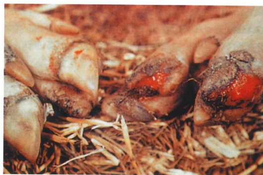
蹄部の水疱病変(豚).