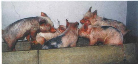
慢性型の豚熱 (実験感染). 発育不良(削瘦), 皮膚病, 被毛の粗雑化などを示す.