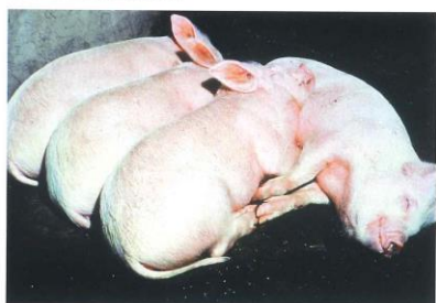
元気消失し、うずくまっている状態を示す。